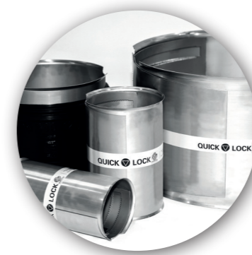
Quick-Lock LEM (Liner-End-Manschette) DN 150 - DN 800 (endelad) DN 700 - DN 1600 (flerdelad)