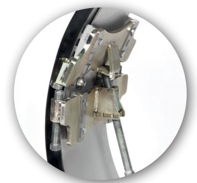
Quick-Lock BIG DN 800 - DN 1300 (tvådelad) DN 1400 - DN 2000 (tredelad)