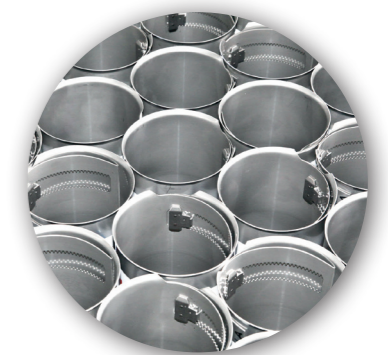
Quick-Lock Brunnen DN 150 - 800