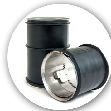
Quick-Lock Mini DN 100, DN 125 und DN 150