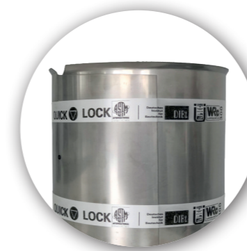
Quick-Lock DN 100 - DN 800 (endelad)

Innerhylsor- Partiell rörrehabilitering och lineranslutning baserad på kompression