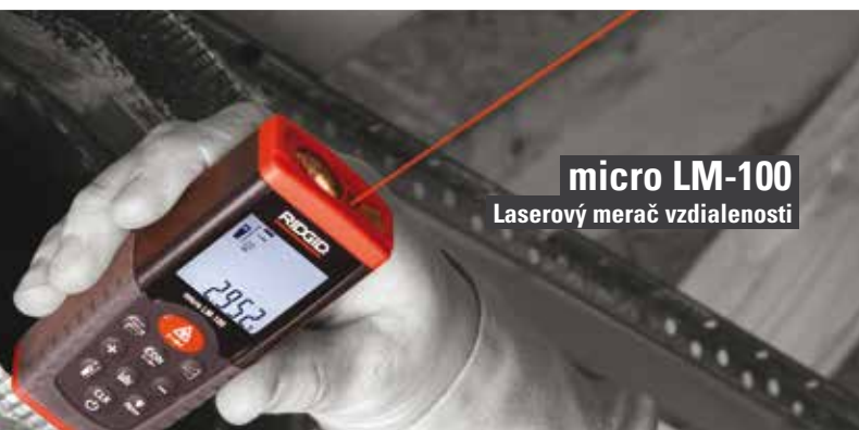
micro LM-100 Laserový merač vzdialenosti