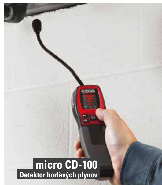
micro CD-100 Detektor horľavých plynov