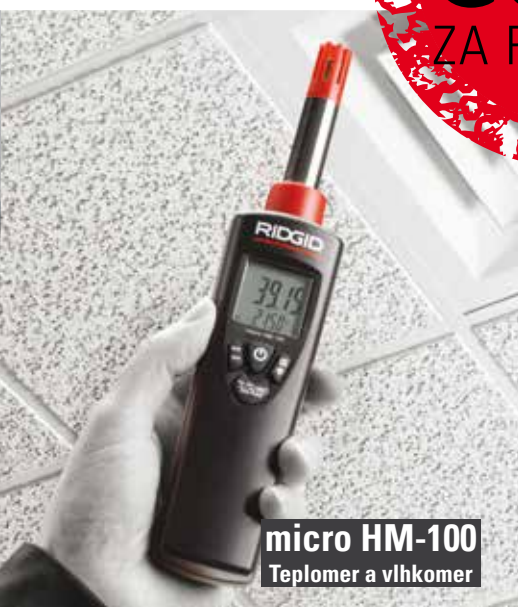
micro HM-100 Teplomer a vlhkomer