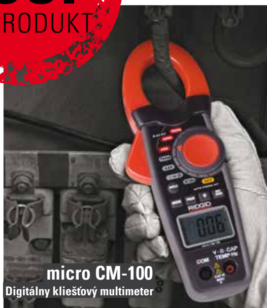
micro CM-100 Digitálny kliešťový multimeter