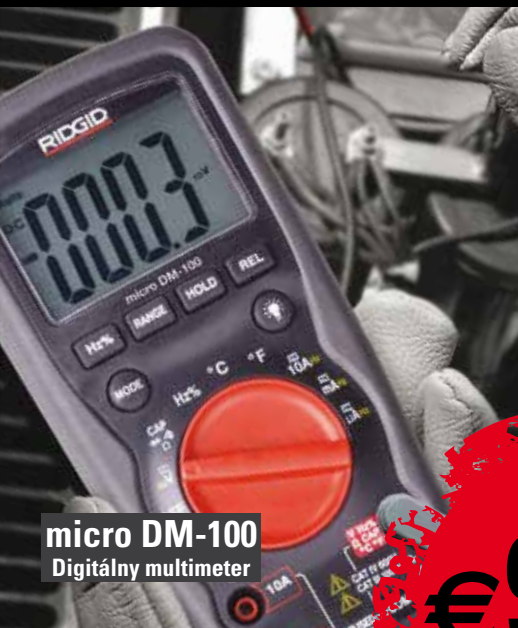
micro DM-100 Digitálny multimeter