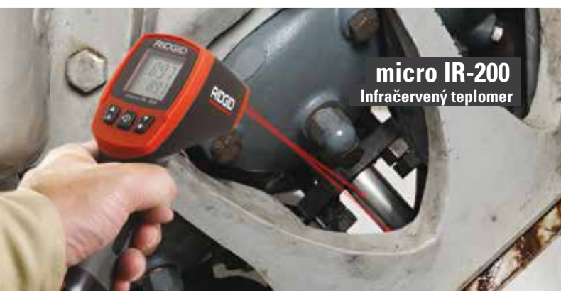
micro IR-200 Infračervený teplomer