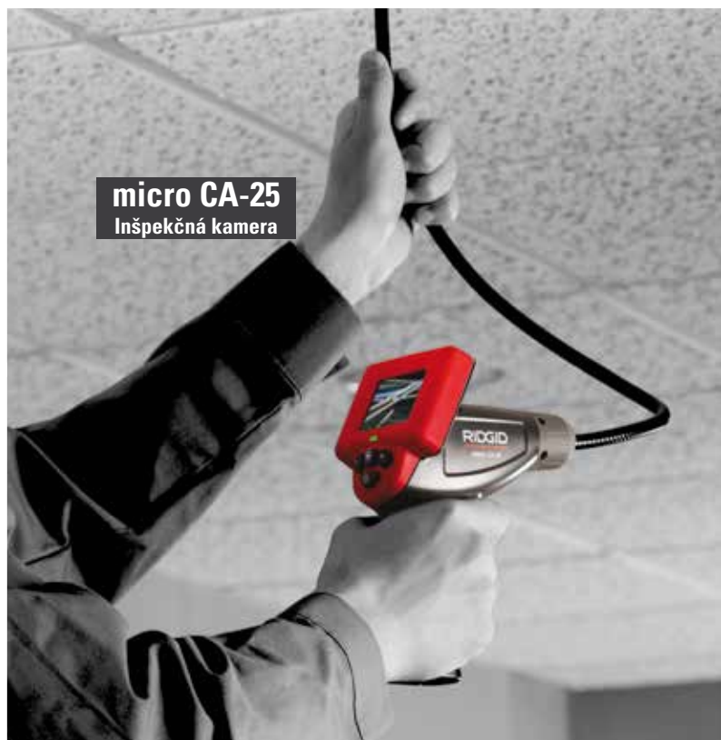
micro CA-25 Inšpekčná kamera